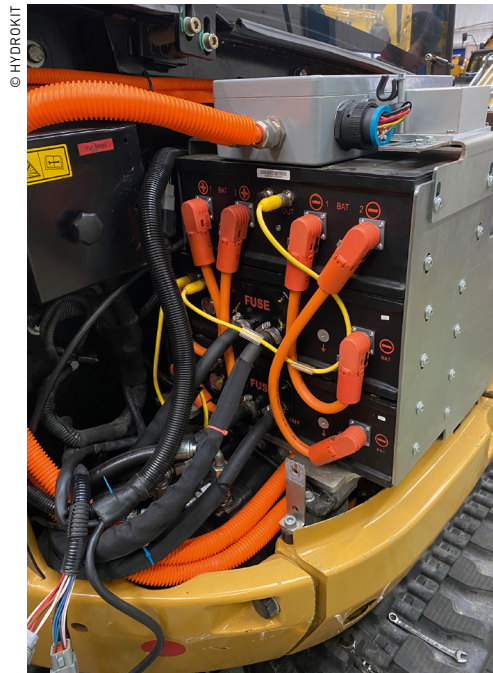
Le retrofit, ou remise à jour des engins mobiles, est validé d'un point de vue normatif.

Mobile & Offroad Parker Hannifin, complète : « l'une des forces de l'intégrateur, c'est aussi le câblage, qui permet de proposer des solutions clés en main dans l'électrification. Hydrokit propose un système complet, pas simplement une brique technologique. »