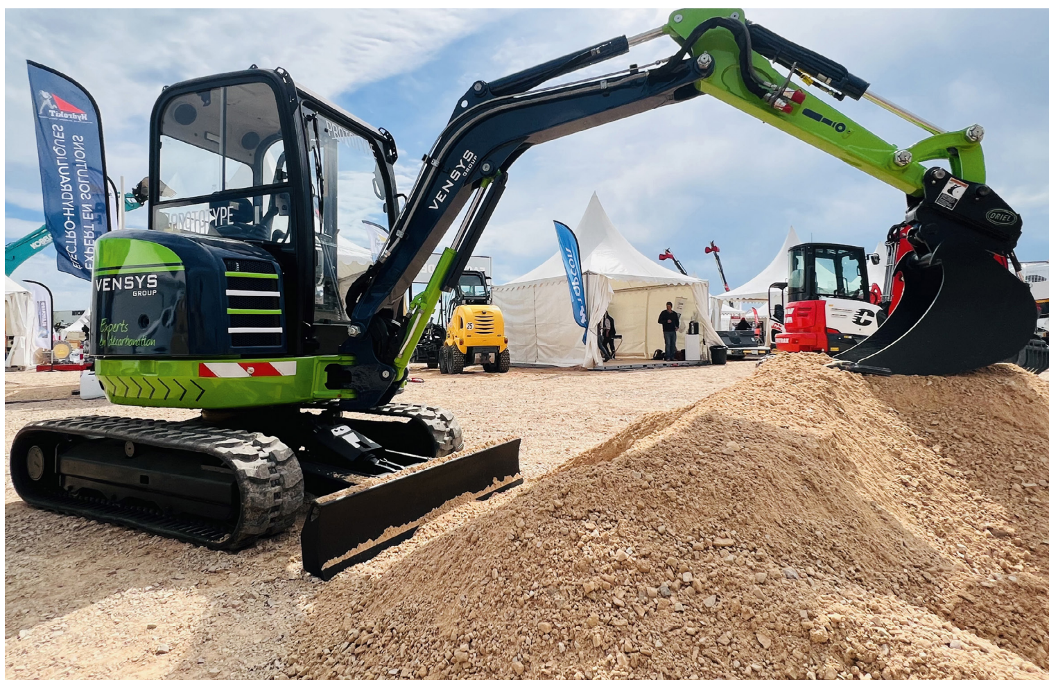
Mini-pelle électrifiée par le groupe Vensys, auquel appartient Hydrokit.

Intégrateur de kits électriques, Hydrokit est aussi un distributeur Parker. Son expertise des engins mobiles le place en excellente position pour satisfaire les exigences réglementaires et environnementales de réduction des émissions de CO 2 des engins off road , de l'agricole au BTP via la manutention.