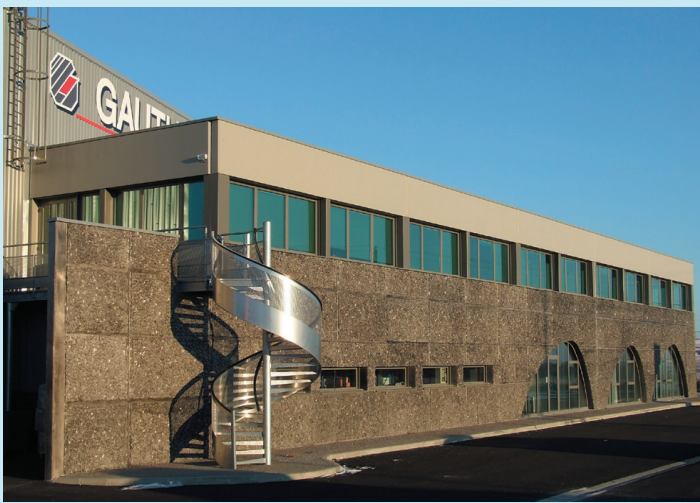
Gauthier SAS a transféré en septembre dernier son siège social sur le site des Fangeas à Solognac-sur-Loire