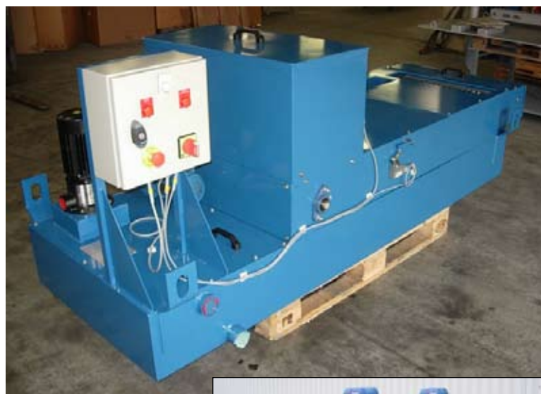
La majorité des réservoirs sont livrés tout équipés

Domange réalise ainsi l'étude, la fabrication, le montage et la mise en route chez l'utilisateur d'une