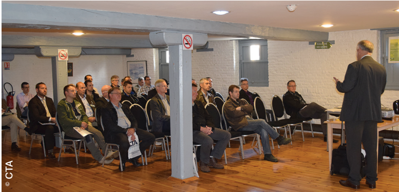
La journée technique organisée par CTA pour célébrer son trentième anniversaire a réuni de nombreux clients, partenaires et fournisseurs.

Conférences sur des sujets d'intérêt général, exposés concernant des thématiques techniques pointues, présentation de produits, moments d'échanges et de partage d'expériences... La journée technique organisée en juin dernier par CTA pour célébrer son trentième anniversaire a réuni de nombreux clients, partenaires et fournisseurs. Une belle reconnaissance pour l'entreprise nordiste qui mise sur la valeur ajoutée et l'intégration des différentes technologies pour se différencier de la concurrence. Une stratégie qui semble lui réussir : les taux de croissance enregistrés au cours de ces dernières années en attestent.