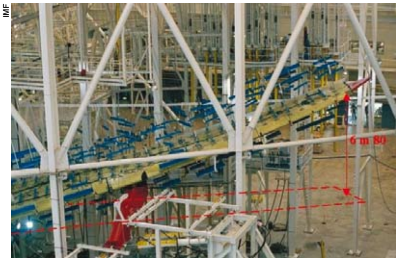
Test de torsion sur aile d'Airbus

Cette adaptation au besoin spécifique du client constitue un des principaux atouts d'IMF qui s'attache à proposer des prestations d'ingénierie et de conseils allant bien au-delà de la