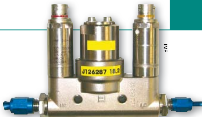
Réducteur de pression pour F1