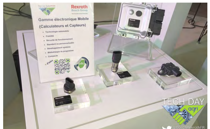
En complémentarité avec les composants stricto sensu, Bosch Rexroth a mis au point une offre électronique dédiée aux applications mobiles.

En complémentarité avec les composants stricto sensu, Bosch Rexroth a mis au point une offre électronique dédiée aux applications mobiles. « Notre gamme de solutions électroniques vise à répondre aux besoins exprimés par les