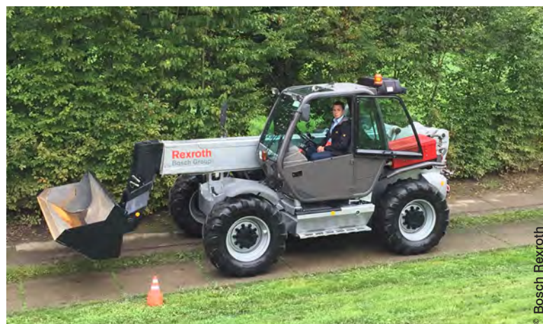
Démonstration pratique d'un véhicule équipée de la commande d'entraînement pour transmissions hydrostatiques Bodas-Drive DRC, solution logicielle personnalisable intégrant entraînement, confort, efficacité énergétique et sécurité intégrée.