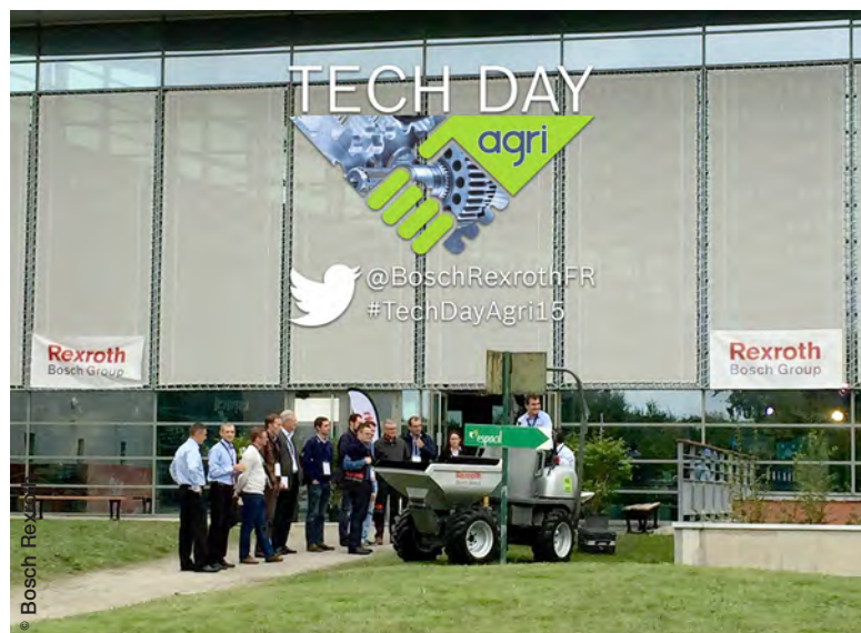
Les Tech Days ont pour double ambition de partager l'expertise du groupe en matière d'applications mobiles et de valoriser l'expérience acquise avec ses clients.

« Les Tech Days ont pour double ambition de partager l'expertise du groupe en matière d'applications mobiles et de valoriser l'expérience acquise avec ses clients. Ce n'est donc pas un hasard si les différents sujets abordés au cours de cette journée ont pour origine les besoins exprimés sur le terrain », a expli-