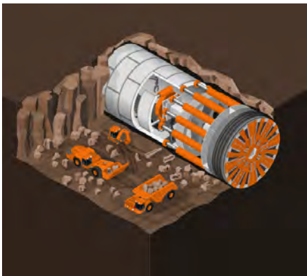
Dans le domaine des systèmes Créa-Méca s'est vue confier l'étude hydraulique, complète de tunneliers par la société NFM Technologies.