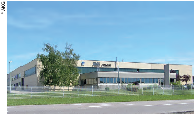
AKG France fête cette année son 25 ème anniversaire.

Spécialisée dans les systèmes de refroidissement, AKG fabrique et commercialise quelque 2,5 millions échangeurs de chaleur chaque année dans le monde entier. Depuis sa création, il y a près d'un siècle, l'entreprise familiale allemande est demeurée fidèle à une stratégie de développement basée sur la R&D et l'investissement qui lui a permis de se constituer, au fil des années, une clientèle fidèle dans de nombreux secteurs d'activité. La filiale française, quant à elle, célèbre ses 25 ans d'existence en renforçant son autonomie et en développant de nouvelles activités.