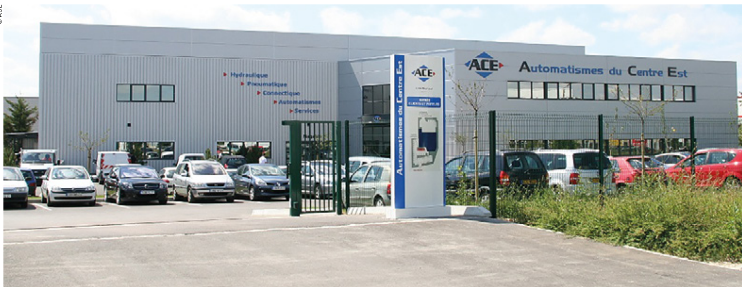
Le site d'ACE à Dijon est sorti de terre en 6 mois à peine.