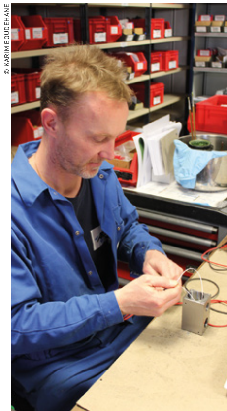
Distributeur hydraulique en cours de montage.