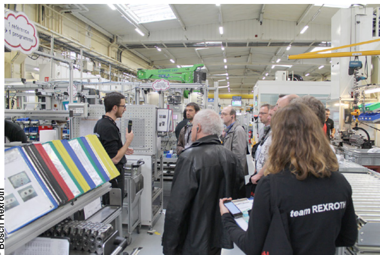
Les thèmes des différents ateliers proposés lors de ce premier Tech Day ont tous été définis à partir des besoins exprimés par les clients.