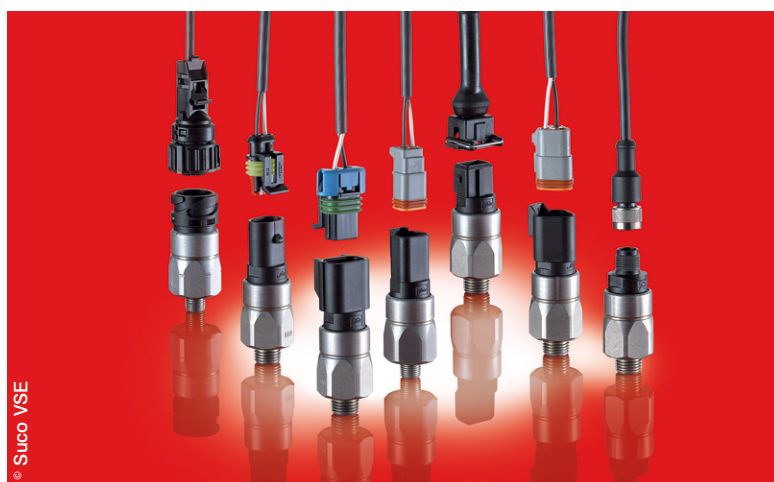
Pressostats Suco avec connecteur intégré, IP67, réglage de 0 à 200 bar, joints NBR, EPDM ou FKM.