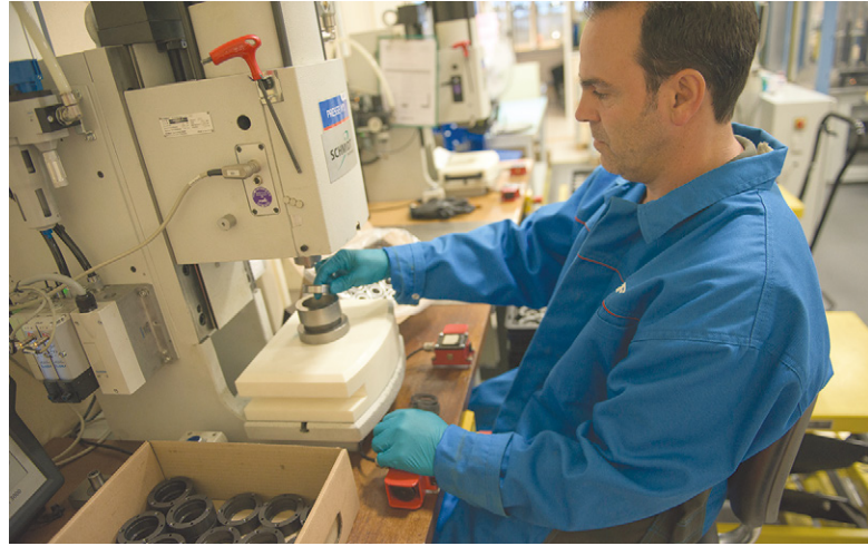
Quelque 350.000 roulements capteurs sont élaborés chaque année au sein de la Solution Factory

Sur l'espace de la Solution Factory dévolu aux activités de reconditionnement et de remise en état de roulements, un robot de graissage a été spécialement conçu pour le remplacement d'une graisse standard par un