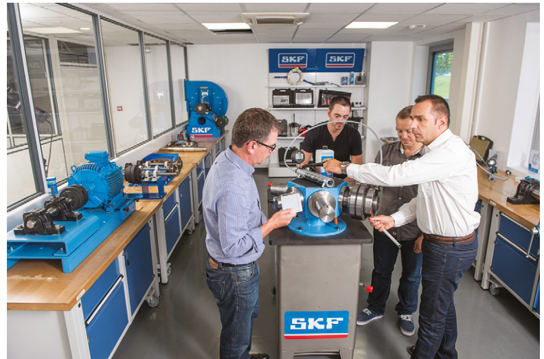
Le centre de formation agréé de la SKF Solution Factory France accueille quelque 550 stagiaires chaque année.

Les salles de formation sont équipées de bancs didactiques sur lesquels les stagiaires peuvent retrouver les conditions réelles de fonctionnement des circuits. Des formations en ligne sont également disponibles pour les personnels n'ayant pas