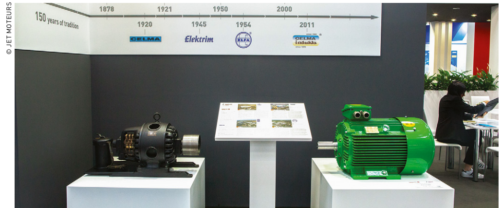
Jet Moteurs est le distributeur exclusif, en France, de Cantoni Moteurs et de Siti.