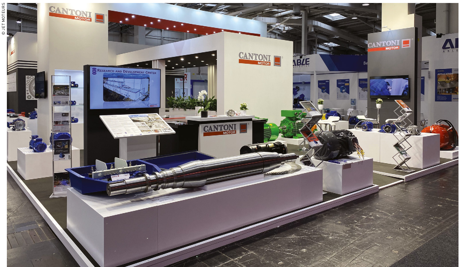
Jet Moteurs, ce sont plus de 6 000 moteurs en stock à Vitré (jusqu'à 250 kW, longueur de fer A-B-C - voir D), et plus de 45 000 moteurs pour le stock européen.

Basée à Vitré, près de Rennes, Jet Moteurs est distributeur exclusif des moteurs Cantoni et Siti, de fabrication polonaise. Avec un chiffre d'affaires de près de 3 millions d'euros réalisé essentiellement dans un grand quart Nord-Ouest du pays, Jet Moteurs revendique une place plus importante sur le marché des moteurs, réducteurs et des freins électromagnétiques, à l'image de la qualité de ses produits.