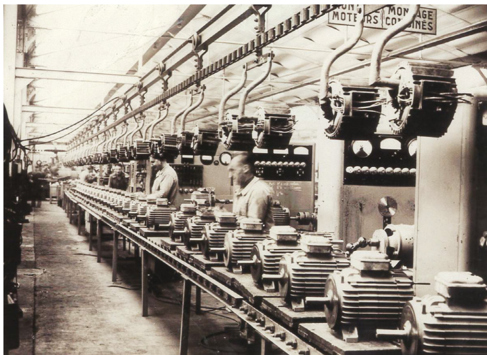
Le site historique des Fonderies Ateliers de l'Ouest (FAO), à Vitré : 500 salariés qui lancent une production de moteurs électriques à destination du secteur agricole.

mondialisation se met en marche en incluant l'Inde et la Chine.