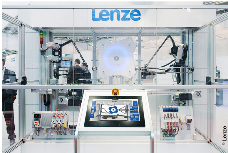
La Easy Machine se veut le symbole d'une volonté de simplification et la représentation de l'ensemble du savoir-faire de Lenze.

► Spécialiste en « Motion Centric Automation » (Automatisation centrée sur le mouvement), Lenze se revendique comme « un des rares fournisseurs du marché à offrir un portefeuille complet et harmonisé de produits et de services », allant du contrôle-commande et de la supervision jusqu'aux variateurs électroniques et aux motoréducteurs, en passant par les logiciels dédiés au développement, à la mise en œuvre et au diagnostic. « Notre but principal est de simplifier la vie de nos clients et pour cela, nous les accompagnons dans toutes les phases