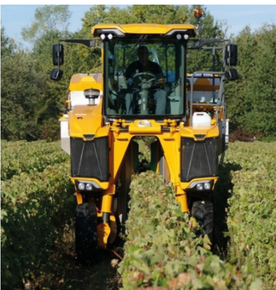
Machine à vendanger mono-rang, enjambant un seul rang.