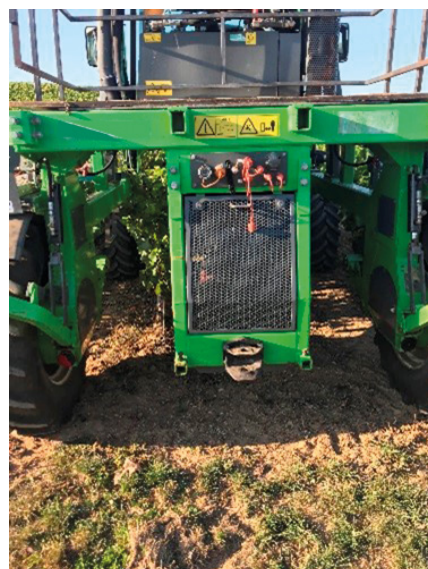
Tracteur vigne étroite, enjambant deux rangs.