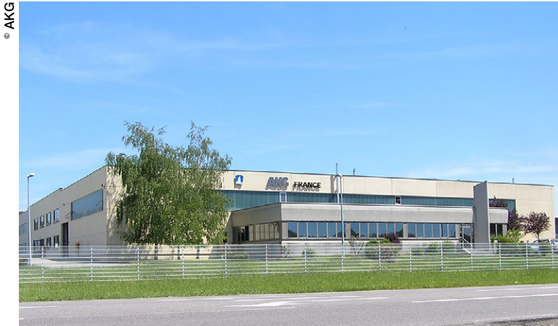
AKG France fête cette année son 25 ème anniversaire.

Spécialisée dans les systèmes de refroidissement, AKG fabrique et commercialise quelque 2,5 millions échangeurs de chaleur chaque année dans le monde entier. Depuis sa création, il y a près d'un siècle, l'entreprise familiale allemande est demeurée fidèle à une stratégie de développement basée sur la R&D et l'investissement qui lui a permis de se constituer, au fil des années, une clientèle fidèle dans de nombreux secteurs d'activité. La filiale française, quant à elle, célèbre ses 25 ans d'existence en renforçant son autonomie et en développant de nouvelles activités.