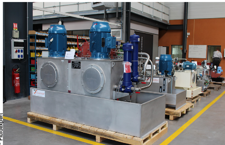
Le groupe Inicia se positionne en tant que spécialiste de la transmission de puissance et du contrôle-commande.

Une dizaine de personnes sont employées au sein du bureau d'études de l'entreprise, où elles travaillent à l'aide de plusieurs logiciels de conception et de simulation telles que Solidworks ou Automation Studio. Le nouveau site est également équipé d'un laboratoire d'analyse de fluides dotés de matériels fournis par la société Pall, partenaire historique de l'entreprise qui a implanté une quinzaine de ces « laboratoires de proximité » au sein de son réseau de distribution