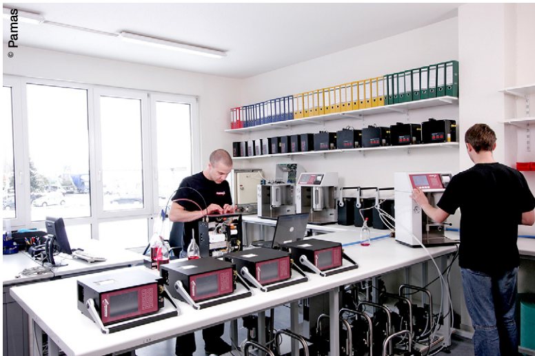
Basé à Rutesheim, au sud de l'Allemagne, Pamas dispose de 10 filiales implantées dans 7 pays.

impliquée dans les travaux de l'ASTM (American Society for Testing and Materials), de l'EI (Energy Institute) et du VDA (Verband der Automobilindustrie). Certifiée ISO 9001 version 2008, l'entreprise est un des membres fondateurs du Cleaning Excellence Center (CEC) et fait partie du VDMA (Verband Deutscher Maschinen und Anlagenbau). Basé à Rutesheim, au sud de l'Allemagne, Pamas dispose de 10 filiales implantées dans 7 pays. L'entreprise participe à plusieurs salons professionnels en 2017, parmi lesquels ConExpo et IFPE (International Fluid Power Exhibition) à Las Vegas, du 7 au 11 mars, Forum Labo Biotech à Paris, du 29 au 31 mars, à la foire de Hanovre, du 24 au 28 avril, et à l'OTC (Offshore Technology Conference and Exhibition) à Houston, du 1 er au 4 mai. ■