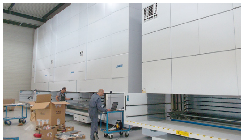
L'entreprise a mis à profit l'emménagement au sein des locaux de Mennecy pour équiper ses stocks de quatre nouveaux magasins verticaux automatiques.

D'une superficie couverte de 4.000 m 2 , le siège de la filiale française est implanté sur un terrain de 13.000 m 2 permettant d'envisager sans problème toute possibilité d'extension si le besoin s'en fait sentir. La majeure partie des locaux est consacrée à un stock de produits finis et de pièces détachées valorisé à quelque 3,5 mil-