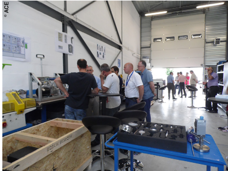
ACE sait qu'elle peut compter sur le soutien de ses partenaires fournisseurs dans le cadre de la réalisation de ses projets de développement.