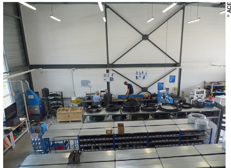
Le nouveau site est parfaitement adapté à l'activité de l'entreprise, mais également tout à fait conforme à l'image de la société ACE tout entière.

De fait, aujourd'hui, ACE est un véritable petit groupe qui emploie 152 personnes et devrait réaliser un chiffre d'affaires de 24,5 millions d'euros cette année (contre 21,5 millions d'euros en 2015). Au-delà de son siège de Dijon, qui regroupe le stock central et l'ensemble des moyens d'études et de fabrication, l'entreprise bourguignonne s'est étendue géographiquement au fil du temps en s'implantant à Clermont-Ferrand, puis à Montluçon et à Chalon-sur-Saône. Au cours des deux dernières années, ACE a augmenté sa zone de chalandise avec la création des sites de Limoges et de Saint-Etienne.