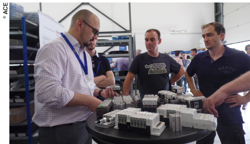
L'entreprise bourguignonne met un point d'honneur à développer des liens étroits avec ses partenaires.

Cette reconnaissance vient consacrer les efforts déployés par ACE pour aller au-delà des composants et se positionner en tant que spécialiste d'équipements complets livrés clés en main. Cette tendance ne fera que s'accroître, prévoient les res-