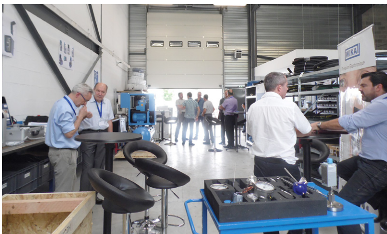
Les prestations d'ACE démarrent dès la phase de conception des projets et vont jusqu'au contrôle des équipements sur bancs d'essais avant leur livraison, leur installation et leur mise en service.

Cette volonté d'amélioration continue se retrouve également au niveau de la qualité. Déjà certifiée ISO 9001, ACE a engagé une procédure de certification MASE, référentiel faisant autorité en termes de sécurité, de santé et d'environnement. Cette démarche devrait aboutir dès le début de 2017, concrétisant encore un peu plus la volonté d'ACE de participer pleinement aux futurs enjeux industriels en matière d'économie d'énergie, d'environnement et de sécurité... ■