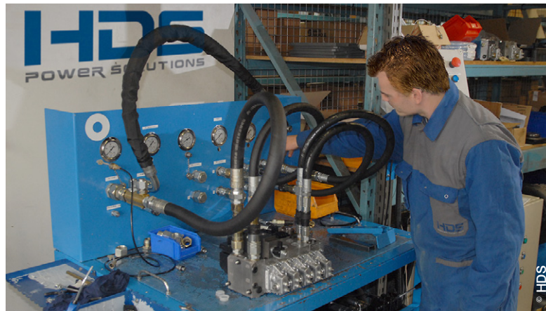
Banc de tests dédié à la gamme PVG de Danfoss Power Solutions

HDS s'appuie pour développer ses activités. « Nous avons toujours veillé à mettre nos capacités en adéquation avec les besoins de nos clients », fait remarquer Damien Fétis. Les locaux dans lesquels l'entreprise a emménagé au début de l'année en témoignent.