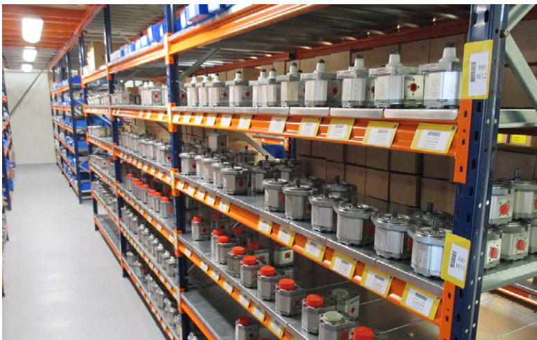
Le stock de HDS est riche de 4.000 références.