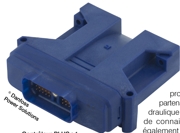
Contrôleur PLUS+1 : « safety controller », conçu pour des applications SIL2.

la conception de leurs projets, en amont, jusqu'à la maintenance et la réparation de leurs équipements, en aval. Doté de deux bancs d'essais pour distributeurs proportionnels, pompes et moteurs, l'atelier dispose des moyens nécessaires pour assembler, tester et réparer les composants hydrauliques. Cet ensemble de prestations