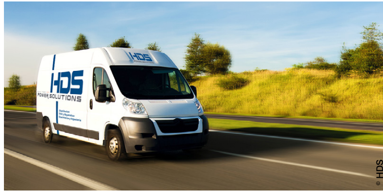
Camion d'interventions sur site.

L'investissement constitue également un autre pilier sur lequel