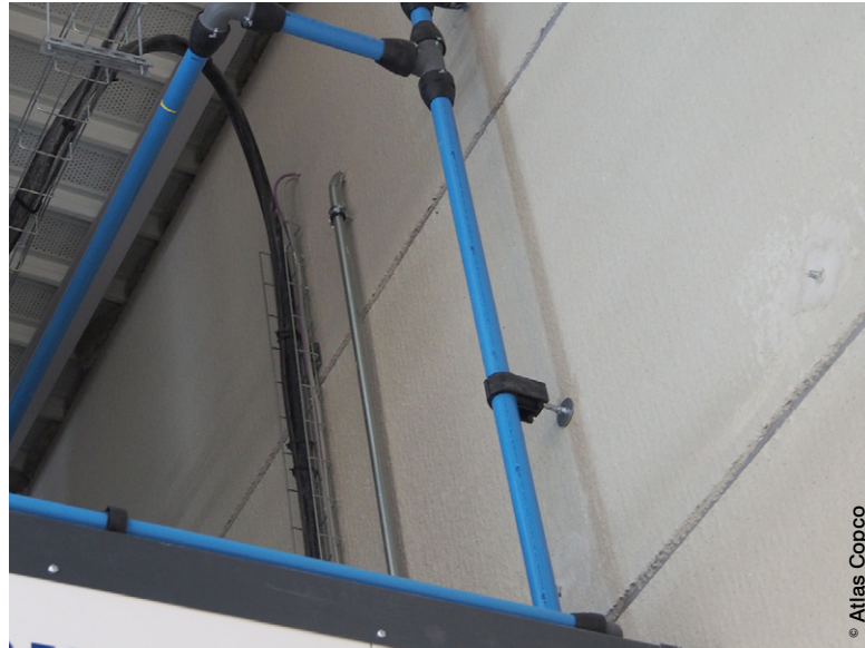
Le réseau Airnet d'Atlas Copco est constitué d'éléments pré-serrés en usine pouvant être assemblés rapidement et facilement par un seul installateur, sans recourir à des outillages lourds.

La réalisation de l'ensemble du projet a été confiée à A Page Miclaud, distributeur exclusif d'Atlas Copco. Depuis sa création en 1989, cette société est spécialisée dans la conception et la réalisation de solutions de production d'air sous pression. Dans le cadre du projet de Saint-Witz, les prestations d'A Page Miclaud ont englobé l'étude du réseau, la définition des équipements, leur installation et leur mise en service. Un contrat de maintenance a également été signé avec Bauer Paris afin de