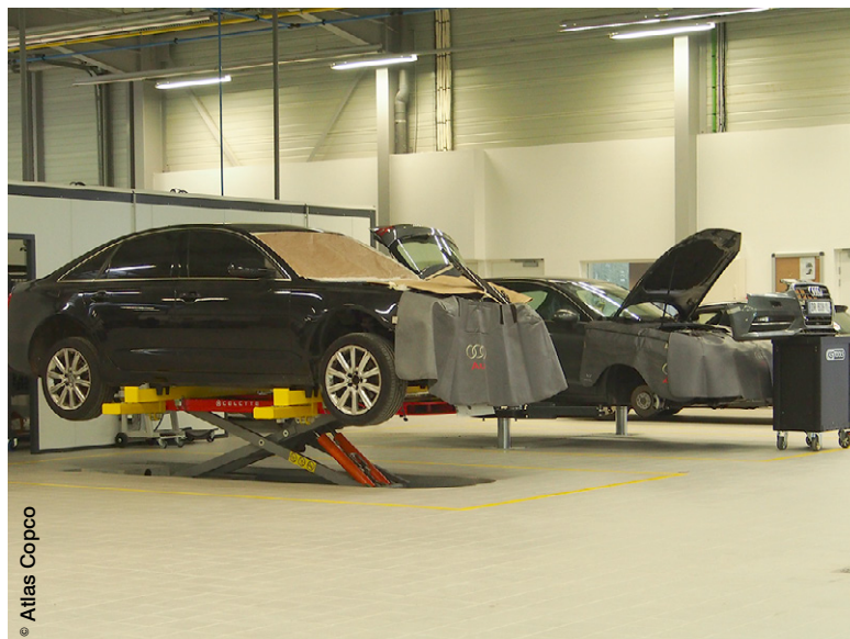
L'air comprimé est utilisé partout au sein des ateliers de Saint-Witz et permet de faire fonctionner tant les ponts de redressement que les cabines de peinture que les nombreux outils utilisés par les opérateurs intervenant sur les véhicules.

Lancés sur le marché en 2013, les GA VSD+ se distinguent notamment par une emprise au sol réduite de moitié du fait de leur alignement vertical. Le cœur de la machine est constitué d'un bloc moto-compresseur totalement fermé. Un moteur à aimants permanents a été spécialement développé pour être assemblé sur les étages de compression dédiés à la vitesse variable. Ce qui permet à la machine de s'affranchir de tout engrenage et courroie, puisque le moteur et l'étage de compression forment une même unité fonctionnelle. L'élément à vis est solidarisé au moteur par