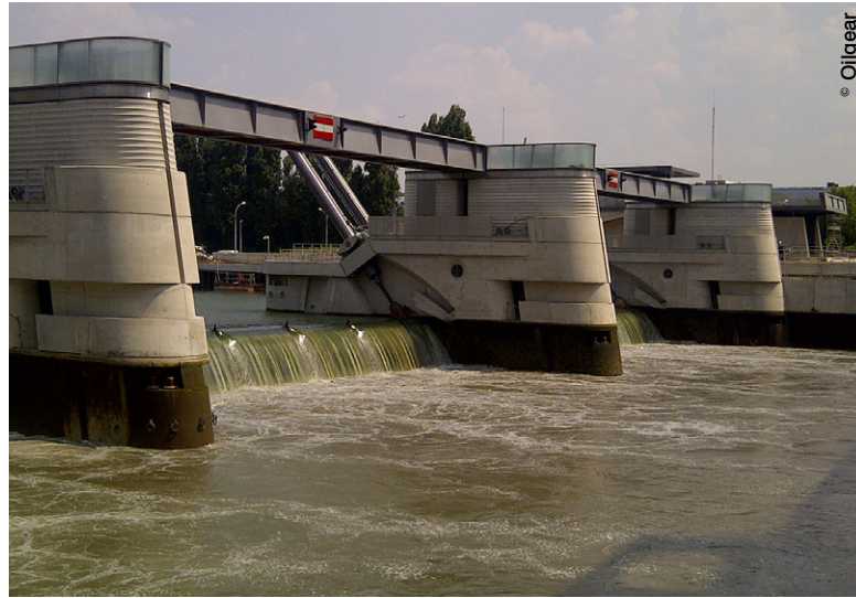
Une autre réalisation commune Oilgear/Douce Hydro : la motorisation hydraulique du barrage de Chatou (Yvelines).