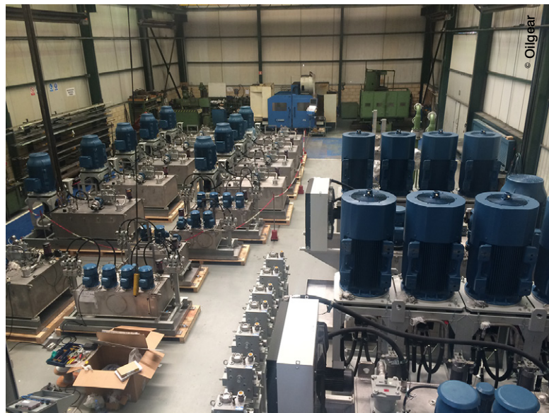
Vue de l'usine d'Hernani d'Oilgear : les centrales hydrauliques destinées au port d'Anvers.

Le service d'ingénierie d'Oilgear France s'est notamment doté d'outils logiciels performants permettant de réaliser des simulations dynamiques de systèmes électrohydrauliques complets. Leur mise en œuvre se traduit par un gain de temps appréciable et des économies substantielles au moment de la définition des équipements. L'entreprise possède également une grande expérience dans le développement de programmes automates et de supervision.