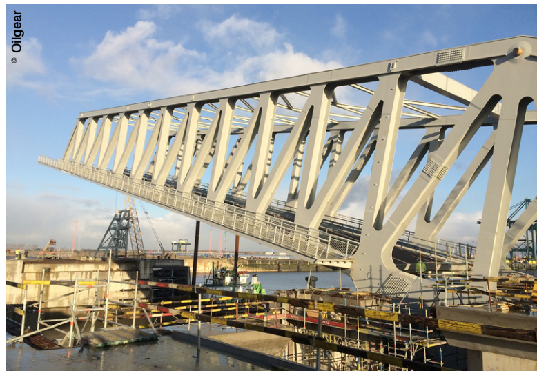
Douce Hydro et Oilgear ont pris en charge la motorisation de l'ouverture et de la fermeture de deux ponts basculants de 70 mètres de longueur et d'un poids de 4.000 tonnes ainsi que le fonctionnement des portes de ce qui constitue, à ce jour, la plus grande écluse du monde à Anvers.

La puissance hydraulique et le contrôle-commande chez Oilgear. La réputation des deux entreprises dans le domaine des solutions électrohydrauliques n'est plus à faire. Les grandes réalisations menées à bien en France et dans le monde entier sont là pour en témoigner. Ce qui explique que, conscientes de la complémentarité technique de leurs offres, elles aient décidé de faire front commun sur un certain nombre de projets requérant des compétences multiples. Et, de fait, les capacités respectives des deux partenaires se trouvent considérablement renforcées lorsqu'elles sont combinées dans le cadre d'offres globales. Car le marché évolue. Il s'agit maintenant de répondre au mieux aux attentes de clients désireux de traiter avec des spécialistes capables de prendre en charge des réalisations clés en main. Dans ce contexte, les deux entreprises se sont dotées, au cours de ces dernières années, des capaci-