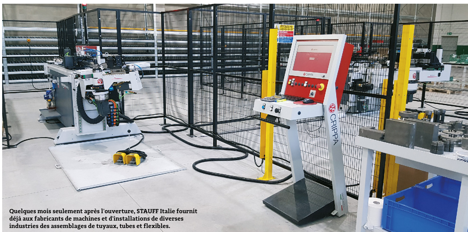
Quelques mois seulement après l'ouverture, STAUFF Italie fournit déjà aux fabricants de machines et d'installations de diverses industries des assemblages de tuyaux, tubes et flexibles.

STAUFF Italie est déjà la huitième succursale du réseau mondial à offrir aux fabricants OEM de machines et d'équipements des tubes et des tuyaux manipulés et prêts à assembler en tant que partie essentielle de l'approche STAUFF Line.