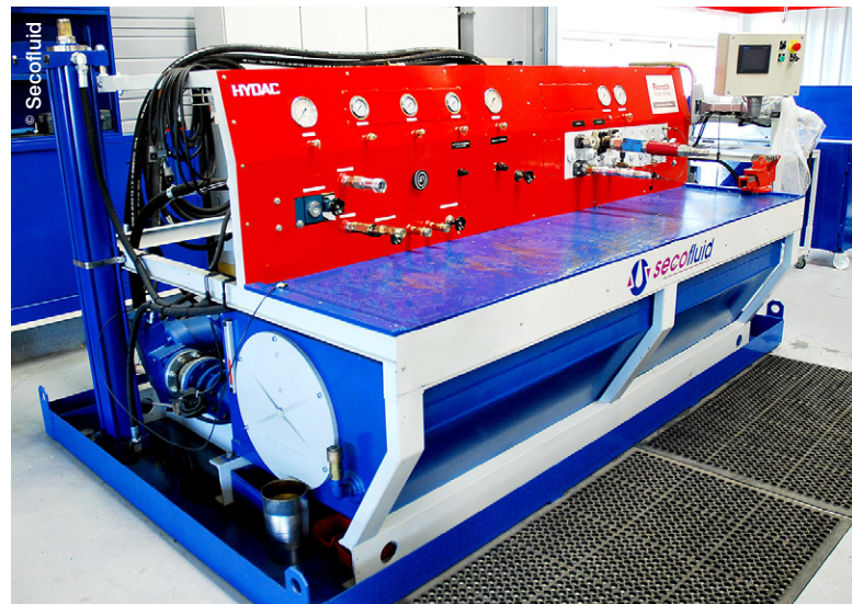
Banc de tests Systemes