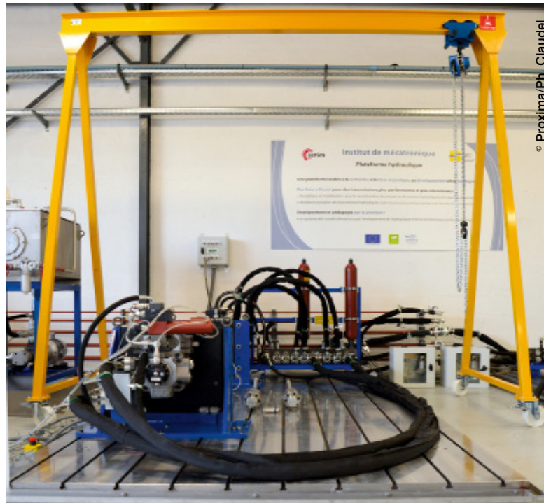
Banc énergétique et modélisation, capacité nominale 75 kW, 500 N.m, 3400 tr/min.

Moins d'un an plus tard, la mise en place d'une chaire dédiée à l'hydraulique et à la mécatro-