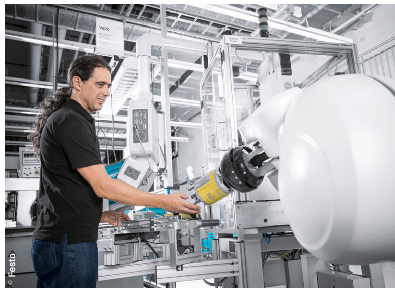
Travail « main dans la main » et en toute sécurité entre l'homme et le robot pour l'assemblage des distributeurs.