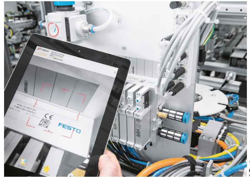
La tablette, principal outil de travail pour les ingénieurs au sein de l'usine de Scharnhausen.

Fonctionnant 24h/24, 7j/7, et fortement automatisé, le parc