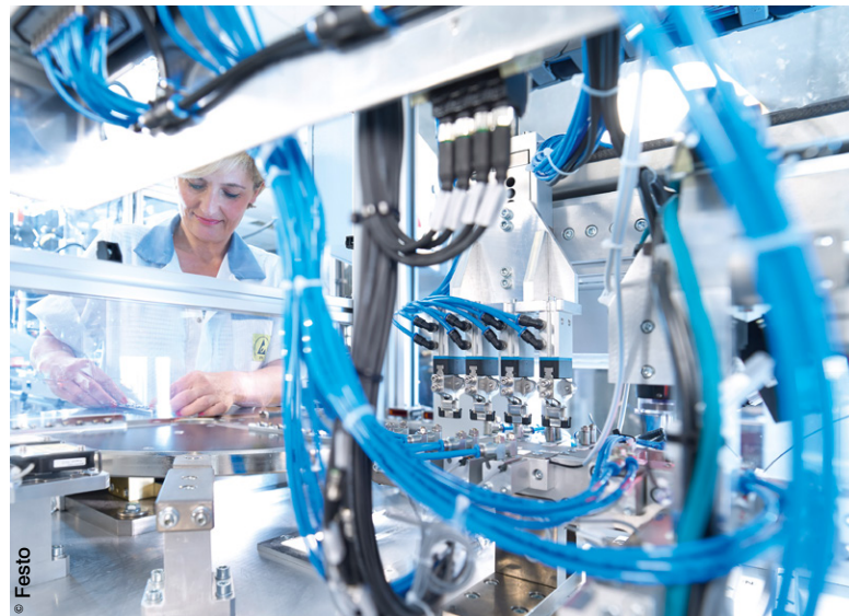
Quelque 200 personnes sont employées à la fabrication de composants électroniques au sein de l'usine de Scharnhausen.

► Quelque 66.000 m 2 sur 4 niveaux, 1.200 employés, un parc machines hautement sophistiqué... le tout représentant un investissement de 70 millions d'euros. Le moins que l'on puisse dire est que Festo n'a pas lésiné sur les moyens lors de la construction de sa nouvelle usine technologique de Scharnhausen. Fort de ses 17.800 collaborateurs dans le monde, de sa présence dans 176 pays et de ses solutions d'automatisation pneumatique et électrique qu'il fournit à quelque 300.000 clients, Festo revendique une position de "partenaire global" de ces derniers. « Nous sommes présent à tous les niveaux de réflexion, régionaux, nationaux et internationaux, concernant l'industrie 4.0 », souligne Eberhard Veit. Le président du conseil d'administration de Festo AG & Co. KG, met en évidence "les quatre piliers sur lesquels est basée l'industrie 4.0" via l'acronyme « Agile », pour Architecture (système mécatronique, software...), General business models (nouveaux environnements de travail, flexibilité...), Innovations (avec des produits « 4.i » : Intuitifs, Intelligents, Intégrés et communicants via Internet) et LEarning (formation, connaissances...). Sur cette base, il s'agit selon lui de « prouver tant à nos clients qu'à nos partenaires que nous