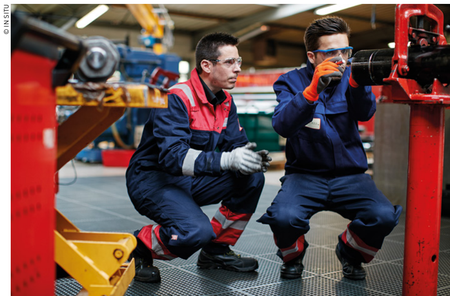
Les experts hydrauliciens d'In Situ font aussi bien de l'audit ou de l'étude que de la formation.

Autre avantage de la formule proposée par In Situ : la possibilité de mieux « digérer » le contenu reçu en étalant