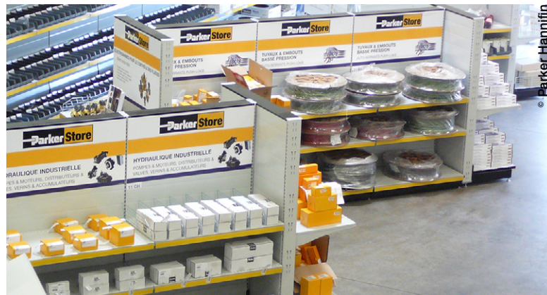
Le 2.000 ème ParkerStore a été inauguré en octobre dernier par la société Mabéo Industries à Chassieu, dans la banlieue lyonnaise

► Les véritables innovations, qu'il s'agisse de produits ou de procédés, ont parfois besoin de temps pour s'imposer sur le marché car elles bouleversent souvent les façons de faire mises en pratique de longue date par tout un chacun. Par contre, dès qu'elles ont apporté la preuve de leur pertinence, leur mise en œuvre ne tarde pas à connaître un coup d'accélérateur notable. Les ParkerStores en donnent un exemple particulièrement remarquable.