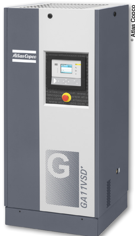
Le GA VSD+ se distingue également par une emprise au sol réduite de moitié du fait de son alignement vertical.

Enfin, le circuit d'huile unique, commun au moteur et à l'étage de compression, assure à la fois la lubrification et le refroidissement.