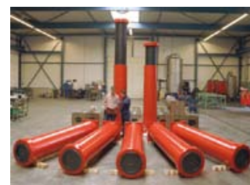
Vérins de levage de ponts ferroviaires et routiers 340 mm / 230 mm course 1600 mm

Chaque crête crée une distorsion de champ magnétique détectée par un des deux capteurs à effet Hall du système. Ces signaux sont transformés par un module électronique intégré en un signal tension standard exploitable par un PC, un automate via une prise RS422A-HTL, ou encore un simple afficheur. La mesure est effectuée par deux capteurs de proximité à effet Hall pointés vers l'axe