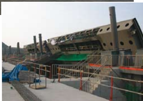
Vue des clapets équipés des vérins de manœuvre