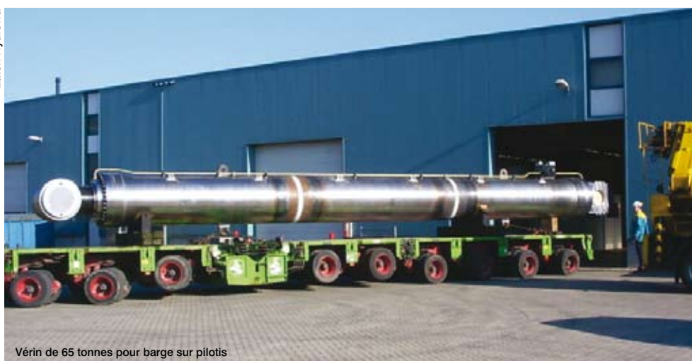
Vérin de 65 tonnes pour barge sur pilots

L'exigence ne faiblit pas avec la taille de l'ouvrage : bien au contraire ! Les applications maritimes et fluviales nécessitent à la fois maîtrise de la force, protection renforcée contre la corrosion et précision fine : il en va de la maniabilité du système, de sa pérennité et de la sécurité des personnes. Ce challenge est relevé régulièrement par Eaton Hydrowa.