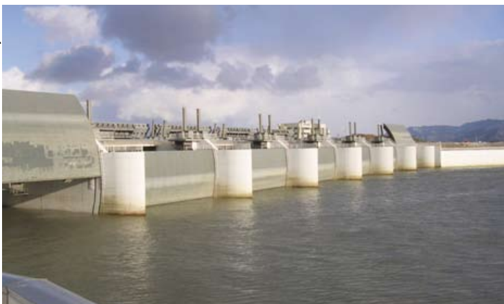
Barrage de Saemangum (Corée du Sud) Vue générale