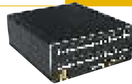
Micropral IO est un module universel d'Entrées / Sorties industrielles à associer à CM ou WL ou tout autre automate du marché. Son originalité est d'être équipé en standard d'entrées sorties de type Tout ou rien, Analogiques et Comptage ainsi que d'une intelligence interne, qui lui permet de soulager le processeur de l'automate de certaines tâches (sans le remplacer !), ou d'être autonome pour des tâches basiques.

Schneider Electric a équipé d'un système basé sur un variateur de 400 \text{ kW} un dérouleur de pipe en fonds marins. Compte-tenu de la profondeur, tout est automatique : « Le tuyau est déroulé sur une roue de 60 \text{ m} de diamètre. Et lorsque le temps se gâte à la surface, il faut couper