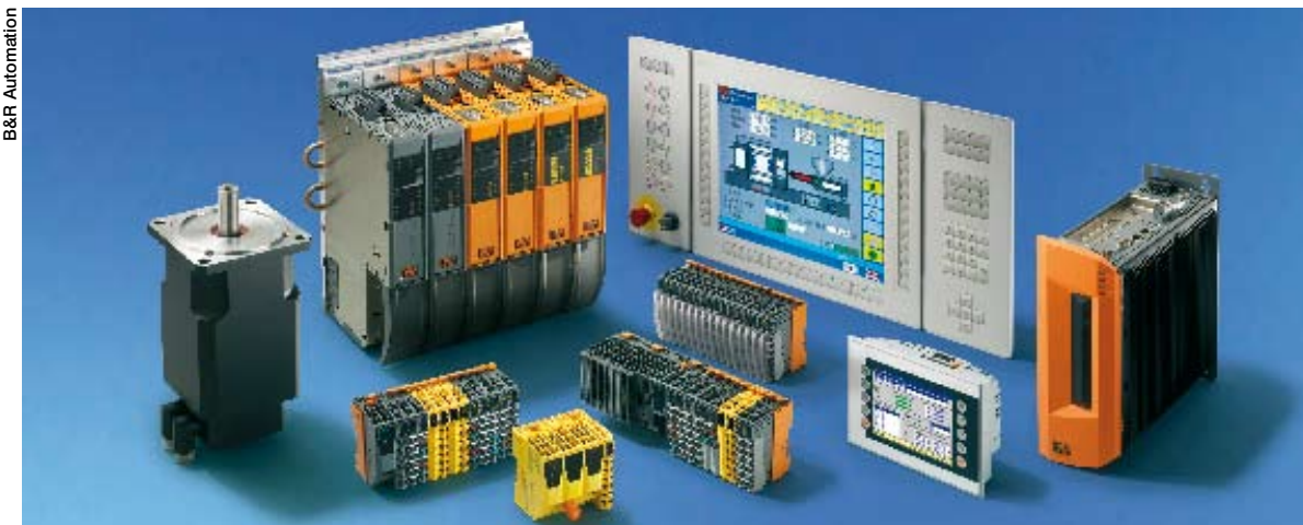
B&R Automation s'appuie sur une gamme de produits étendue (systèmes de contrôle et d'E/S décentralisés, IHM intelligentes à base PC Power Panel, Automation PC et Panel PC intégrant la technologie Intel™ Pentium™ ou Intel® Core™ Duo sans ventilateurs, système d'entraînement ACOPOSmulti pour machines multi-axes) et deux maillons fédérateurs : Powerlink, l'Ethernet industriel standard et B&R Automation Studio, outil logiciel permettant de programmer axes, automates, visualisation et communication sur une seule et unique plate-forme.

Parmi les petits derniers de la gamme : le contrôleur de mouvement Lexium Controller, qui assure la coordination et la synchronisation d'axes, via un bus de terrain CANOpen, pour des applications nécessitant un contrôle jusqu'à 8 axes