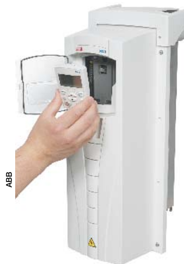
ACH550 de ABB, variateur à boîtier amovible pour les applications HVAC.

synchronisés, et l'automate programmable M340. « Il pilote nos différents produits motion control et les variateurs brushless et asynchrone », souligne Dominique Leduc.