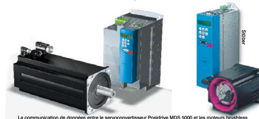
La communication de données entre le servoconvertisseur Posidrive MDS 5000 et les moteurs brushless EK (version courte) et ED (haute dynamique) est exclusivement numérique. Le commutateur d'axe externe Posiswitch AX 500 permet la connexion multiple de moteurs brushless avec un seul servo-convertisseur. Le module combiné au logiciel d'exploitation Positool peut ainsi gérer et commander en alternance jusqu'à quatre axes régulés en fonction de la position et de la vitesse, indépendamment les uns des autres.