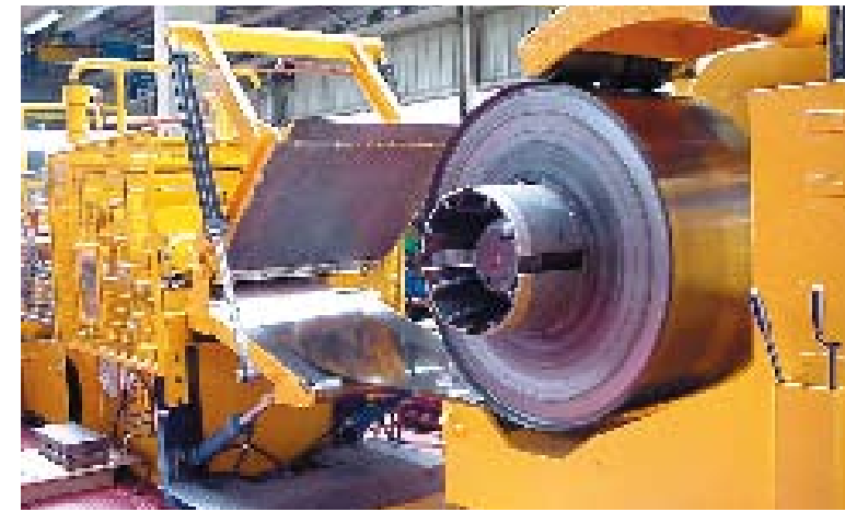
Ligne de déroulage de tôle : Un motoréducteur piloté par un variateur de vitesse régule la force de traction et la vitesse de défilement de la tôle.