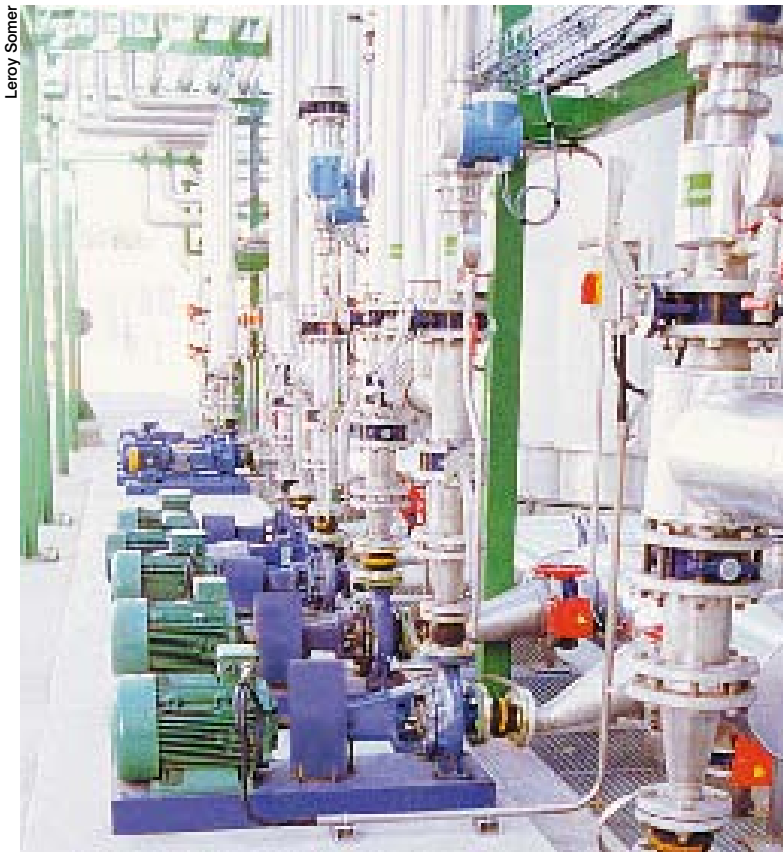
Application pompes centrifuges entraînées par des moteurs et des variateurs de vitesse qui, en régulant la vitesse des moteurs, réalisent des économies d'énergie.

native : Ethernet principalement, mais aussi Profibus DP et DeviceNet. Pour la programmation, deux outils existent - Easy Motion (programmation par définition de paramètre) et Motion Pro, (programmation poussée) - utilisables en six langues de programmation : Graphcet, CFC, Ladder... » décrit Dominique Leduc.