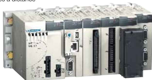
L'automate programmable M340 de Schneider Electric