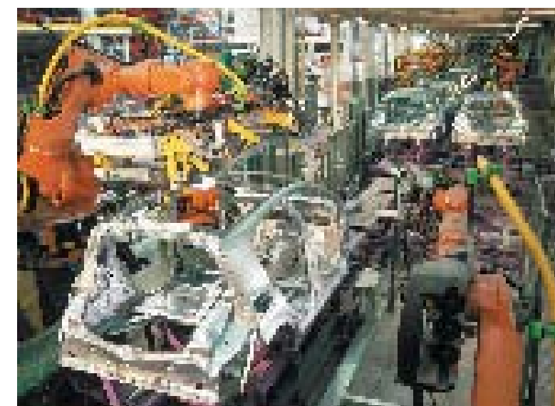
Chaîne d'assemblage automatique dans l'industrie automobile : un motoréducteur frein associé à un variateur de vitesse à positionnement intégré entraînent la chaîne tout en rapidité de mouvements et haute précision du positionnement.

Heureusement, le marché mondial raisonne le plus souvent solution efficace et durable d'abord, pour « être tranquille pour des années ». Par conséquent, les donneurs d'ordres privilégient les solutions « ouvertes » (qui dialoguent dans les différents langages informatiques existant), et donc évolutives.