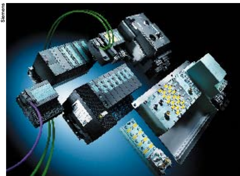
Simatic Safety Integrated : l'automatisation standard et de sécurité réunies par Siemens.

La vitesse d'échange de données est d'ailleurs devenue primordiale pour tout automatisicien qui se respecte : on ne jure plus que par le temps réel ! « L'automate classique présente des temps de cycle de 10 à 20 ms, le PC descend à 1 ou 2 ms. Avec XFC, on passe à 50µs ! », annonce fièrement Pierre Hervy (Beckhoff Automation). « Avec