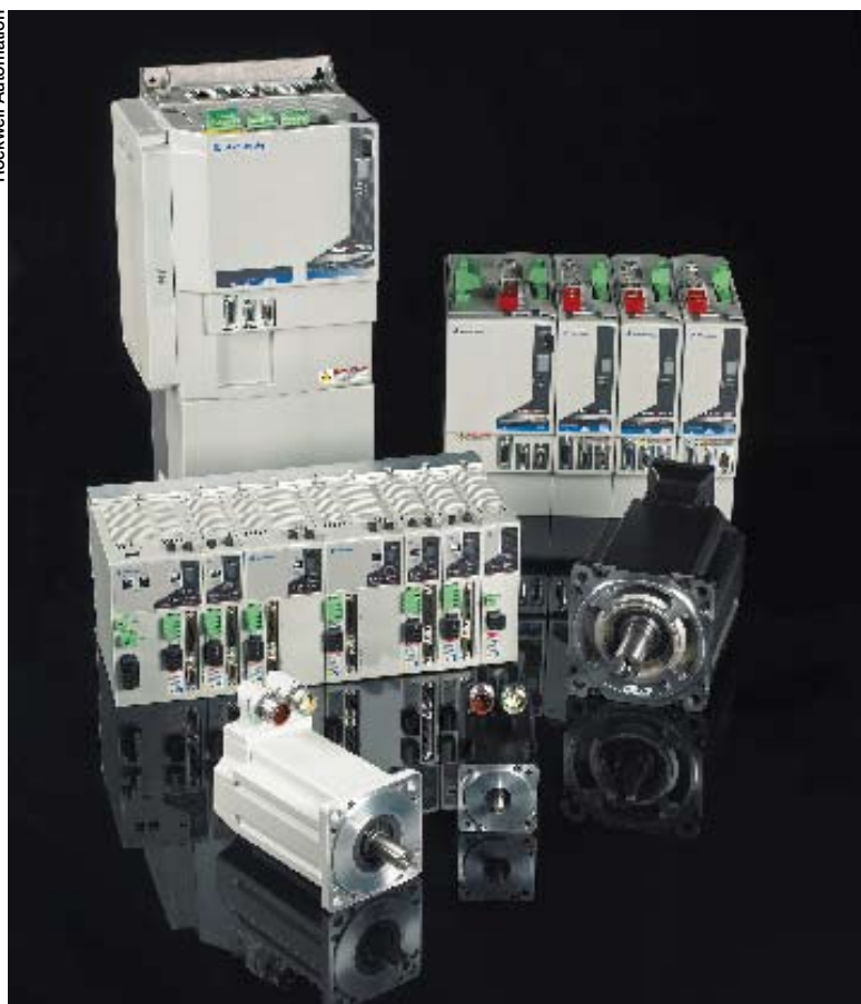
La famille Kinetix de Rockwell Automation, pour la commande d'axes intégrée.

pour soutenir le développement des technologies de réseau ouvertes basées sur le Common Industrial Protocol (CIP™). Son but est de proposer à l'utilisateur final l'interopérabilité des réseaux Ethernet industriels et des produits d'automatisation les plus répandus.