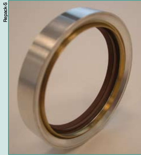
HRWS racler métallique pour tige de vérin

gés, thermoplastiques, élastomères traités PTFE avec différents types d'insert, Repack-S développe, étudie et conçoit de nouveaux produits testés en interne.