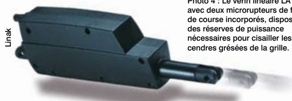
Photo 4 : Le vérin linéaire LA12, avec deux microinterrupteurs de fin de course incorporés, dispose des réserves de puissance nécessaires pour cisailer les cendres grésées de la grille.

Les éléments essentiels du vérin sont le moteur, le réducteur,