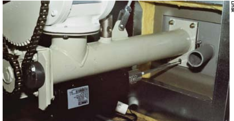
Photo 3 : Sous le réservoir de granulés, le sas de dosage et la vis sans fin d'amenée se trouve le vérin linéaire LA12 qui déplace la grille coulissante pour vider et comprimer les cendres.

Le responsable du bureau d'études et de la production, Erwin Dürnberger (Photo 5, à gauche) se déclare très satisfait de la solution d'entraînement de Linak, car elle lui offre de gros avantages par rapport à la concurrence et d'importantes économies. Il apprécie surtout la compacité, la fiabilité, la résistance aux températures élevées et la forme esthétique du vérin linéaire LA12. Il relève également la grande force de traction et de compression de 750 N, les microinterrupteurs déjà incorporés et ajustés pour la coupure en fin de course ainsi