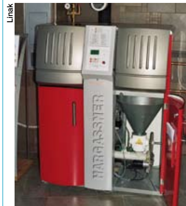
Photo 2 : Les installations de chauffage aux granulés se vendent comme des petits pains grâce à leur rentabilité et à leurs propriétés écologiques. L'enlèvement et le compactage automatiques des cendres permettent un fonctionnement sans interventions durant plusieurs mois.