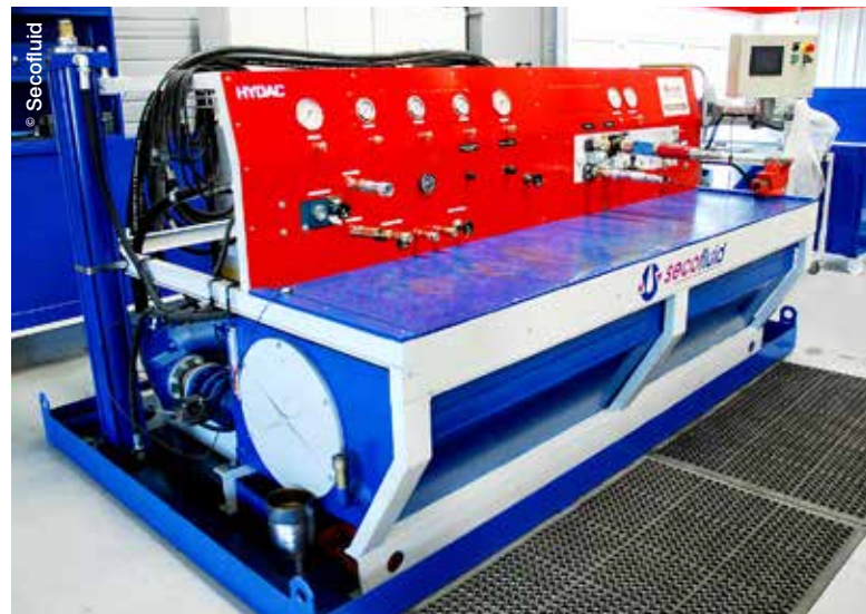
Banc de tests Systemes