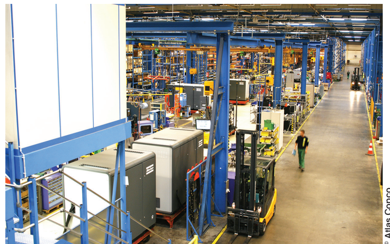
Le SmartLink équipe systématiquement toutes les machines qui sortent de l'usine d'Anvers d'Atlas Copco.

de ses efforts à l'optimisation de celle-ci. La réalisation d'audits chez ses clients participe de cette démarche. « L'Air Scan » proposé par Atlas Copco passe ainsi par la réalisation de plusieurs étapes comprenant l'étude des différents points de consommation dans l'usine afin de déterminer les potentialités de gains énergétiques, la réalisation de tests et de simulations destinées à confirmer ces observations, l'élaboration de recommandations au client dans un souci d'amélioration de la performance de ses équipements, la mise en œuvre des solutions retenues (réparation des fuites, récupération de la chaleur pour la production d'eau chaude, optimisation de la pression du réseau...) et