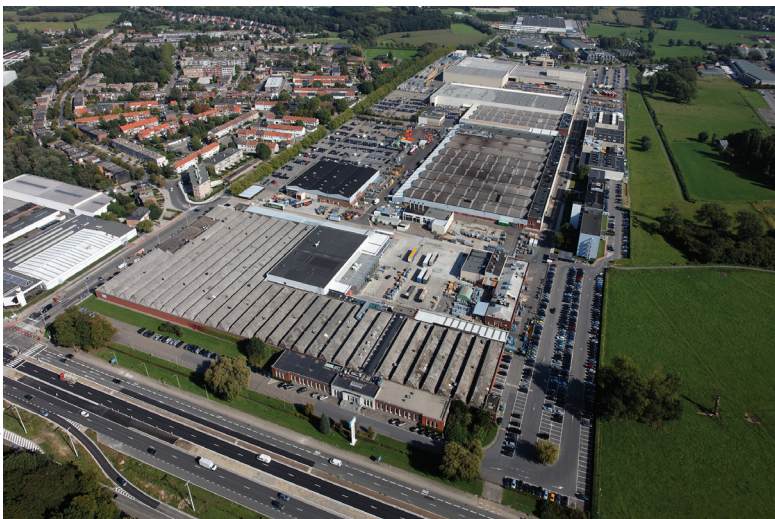
L'usine de compresseurs du groupe Atlas Copco à Anvers.

Atlas Copco ne se contente pas de fabriquer des machines performantes mais s'attache à mettre systématiquement en avant plusieurs valeurs que l'on retrouve en fil rouge tout au long du processus de production, de commercialisation et de service. Parmi celles-ci, l'efficacité énergétique et la responsabilité sociétale vis-à-vis de ses clients, de ses collaborateurs et de son environnement arrivent au premier plan. C'est ce que le leader mondial de l'air comprimé appelle la productivité durable.