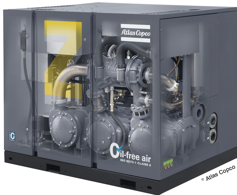
L'air produit dans les trois étages de compression du ZH350+ est certifié à 100% sans huile selon la norme ISO 8573-1 Class 0 (2010), ce qui signifie qu'il n'y a aucun risque de contamination ou de produits endommagés.

Atlas Copco a, en outre, développé toute une série de produits permettant une récupération de la totalité de la chaleur dégagée. Ces produits peuvent être proposés séparément ou intégrés dans des systèmes combinant plusieurs compresseurs, sécheurs et équipements de contrôle et de récupération d'énergie.