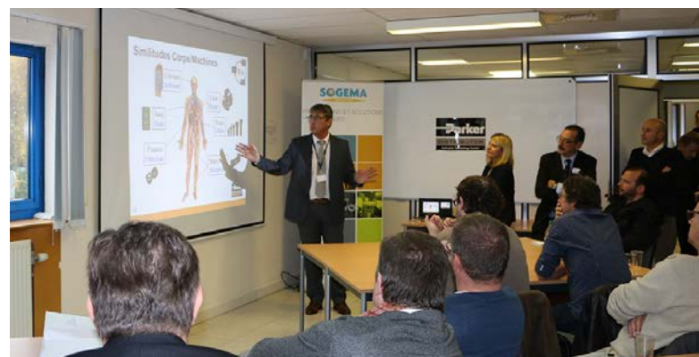
Les participants à la journée technique ont pu assister à plusieurs conférences thématiques ainsi qu'à la présentation des dernières nouveautés Parker.