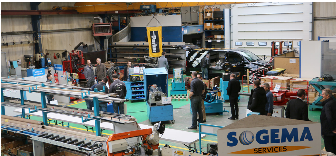
Plus d'une trentaine de clients ont pu découvrir les installations de l'entreprise nordiste lors de la journée du 17 novembre dernier.