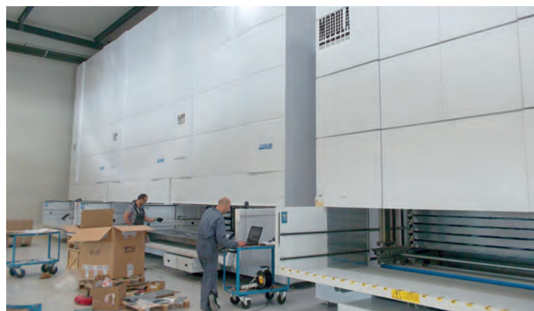
L'entreprise a mis à profit l'emménagement au sein des locaux de Mennecy pour équiper ses stocks de quatre nouveaux magasins verticaux automatiques.

D'une superficie couverte de 4.000 m 2 , le siège de la filiale française est implanté sur un terrain de 13.000 m 2 permettant d'envisager sans problème toute possibilité d'extension si le besoin s'en fait sentir. La majeure partie des locaux est consacrée à un stock de produits finis et de pièces détachées valorisé à quelque 3,5 mil-