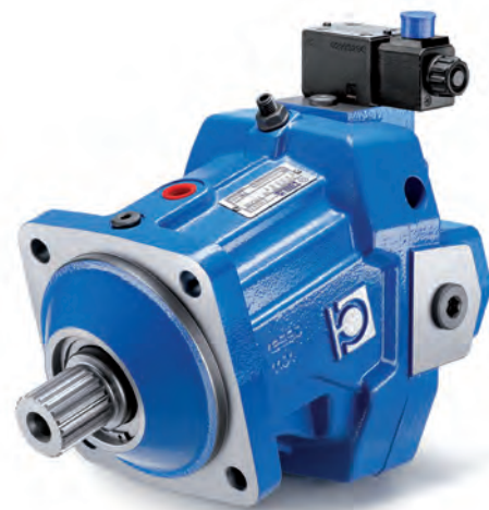
Moteur à axe brisé HPBA80-SX.

Cette stratégie semble avoir porté ses fruits. « Malgré la crise qui sévit depuis ces trois dernières années dans le domaine