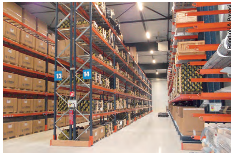
La majeure partie des locaux est consacrée à un stock de produits finis et de pièces détachées valorisé à quelque 3,5 millions d'euros.

L'entreprise a mis à profit l'emménagement au sein des locaux de Mennecy pour équiper ses stocks de quatre nouveaux ma-