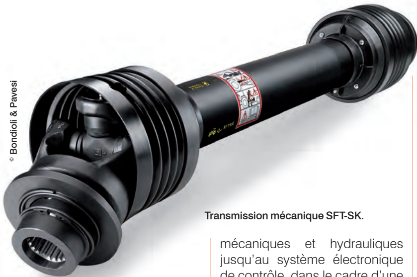
Transmission mécanique SFT-SK.

gasins verticaux automatiques qui sont venus s'ajouter à plus de 3 kilomètres de rayonnages. Plusieurs semi-remorques font la navette chaque semaine depuis le terminal logistique dont dispose le groupe en Italie afin d'assurer l'approvisionnement du stock français. Plusieurs zones de ce stock sont maintenant dédiées à certains grands donneurs d'ordres, soucieux de disposer en permanence des pièces et composants dont ils ont besoin pour le bon fonctionnement de leurs engins mobiles.