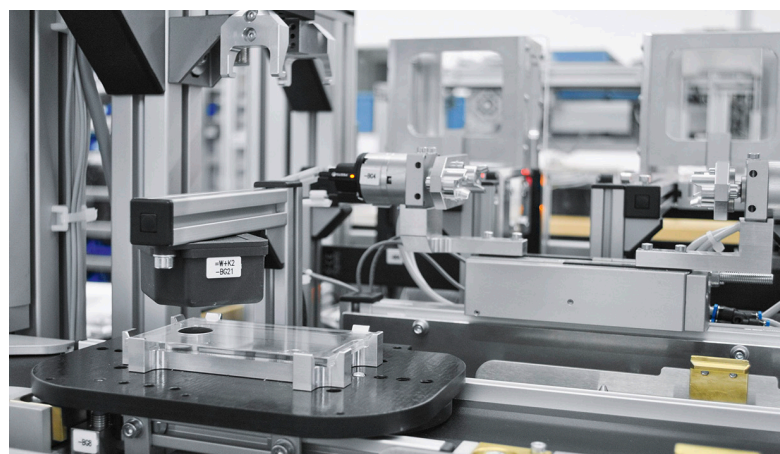
Open Integrated Factory de Festo et SAP : dans la CP Factory de Festo Didactic, les pièces à usiner « indiquent » à la machine comment elles doivent être fabriquées.

Par ailleurs, Festo et SAP exploitent ensemble l'Open Integrated Factory au siège de SAP, à Levallois-Perret (92). Cette véritable solution Industrie 4.0 démontre clairement comment intégrer production et technique de l'information. A l'aide de la reproduction de stations individuelles d'une installation de production basées sur le système d'apprentissage CP Factory de Festo Didactic, les deux partenaires illustrent la façon dont le niveau de l'atelier (Shopfloor) et le Manufacturing Execution Systems (MES) peuvent être interconnectés. La particularité de cette ligne d'assemblage intelligente longue de 8,60 m seulement réside dans les pièces à usiner qui « indiquent » elles-mêmes à la machine comment elles doivent être traitées ! « Les objets intelligents communiquent avec l'installation via la technologie RFID. Une fois arrivés au poste déterminé, ils indiquent dans quelle pièce ils se trouvent et dans quelle variante, et demandent à être traités avec la méthode appropriée », explique Frédéric Puche, directeur de l'Experience Business Center de SAP. En utilisant des standards définis, il est possible de fabriquer des variantes de produits dans n'importe quel ordre et en quantité donnée, dans une seule ligne de production. Dans ce cadre, un lot de taille 1, soit la fabrication d'un produit unique aux