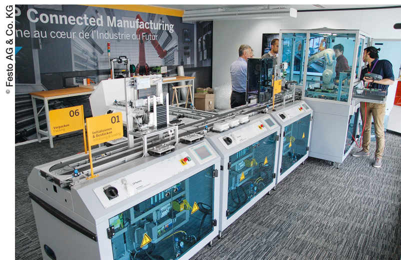
Une véritable solution Industrie 4.0 : l'Open Integrated Factory conçue dans l'Experience Business Center SAP, à Paris, démontre clairement comment intégrer production et technique de l'information.